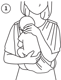
신생아는 개구리 자세로 착용