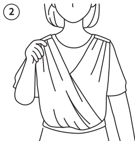
어깨선에 맞춰 슬링 정리 후