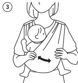
아기의 오른쪽 다리를 먼저 넣고