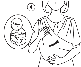
나머지 슬링 날개를 펼쳐 감싸기