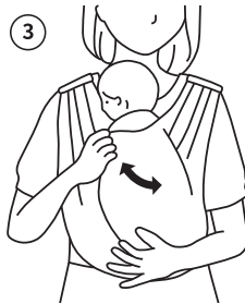
슬링 날개를 펼쳐 아기 감싸기