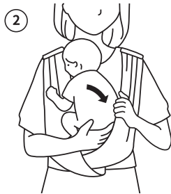
다리와 몸체 전부 슬링 왼쪽에 넣고